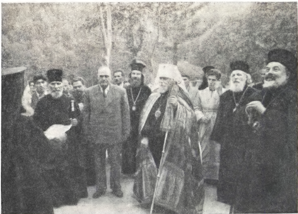
МИТРОПОЛИТ НИКОЛАЙ У СВ. ВОРОТ РЫЛЬСКОГО МОНАСТЫРЯ